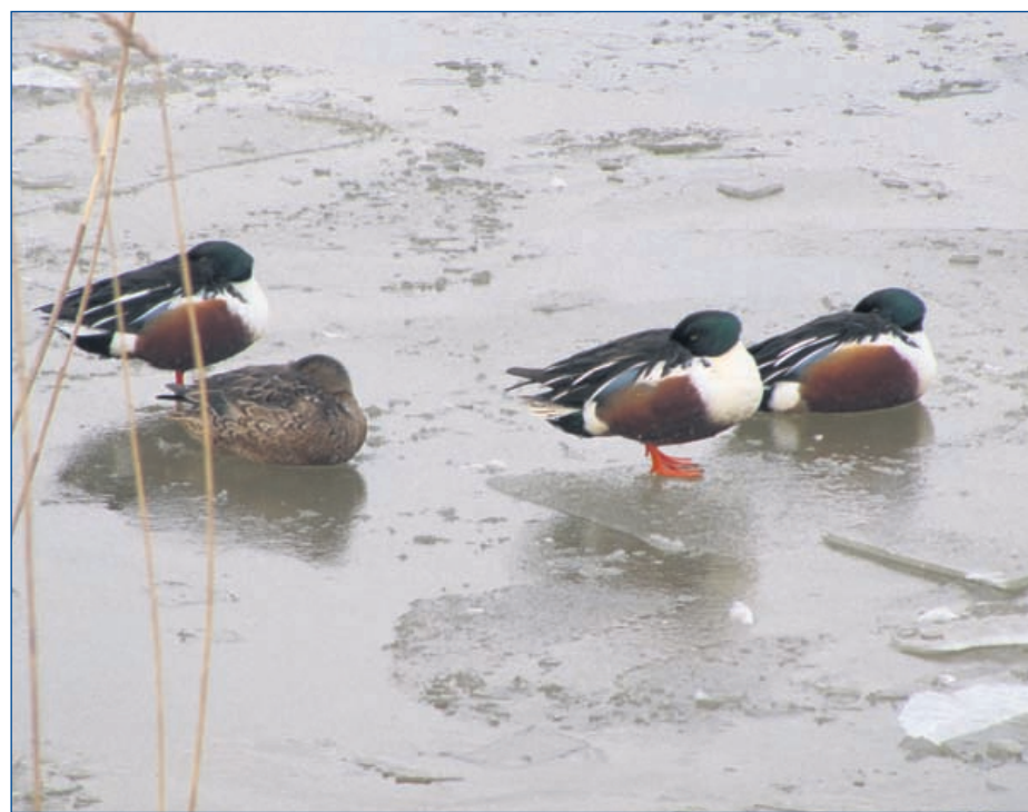
Vier rustende slobeenden in het Twistvlietpark