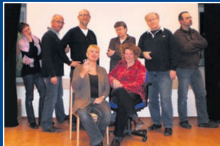
04 Stadshagen op Planken