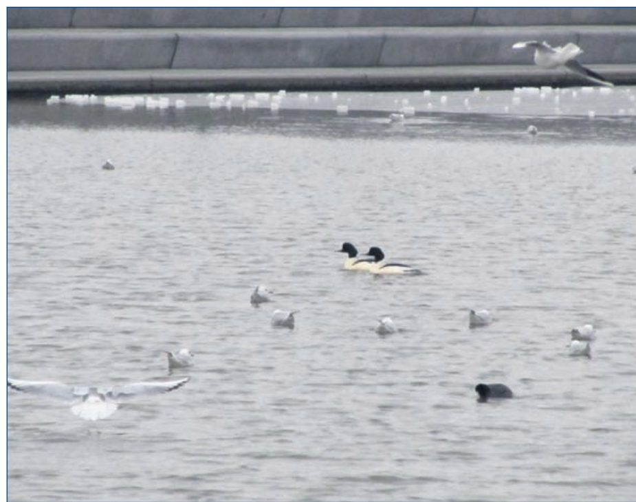
Twee vissende mannetjes van de Grote Zaagbek

In de winter zijn in Stadshagen veel bijzondere waarnemingen te doen. Let goed op dat je de mooie mannetjes niet mist. Zeker bij vogels. Of dit ook geldt bij mensen, laat ik graag over aan je eigen beleving.