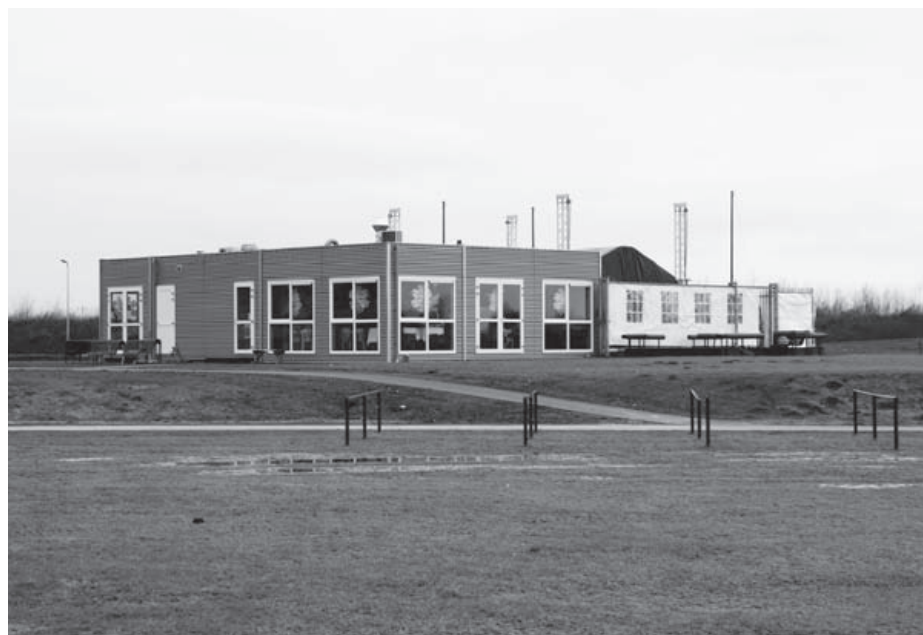
Het Strandhuis Milligerplas

Alle workshops vinden plaats in de computerruimte van dienstencentrum Werkeren. De kosten zijn € 10,-. Heeft u belangstelling, dan kunt u aanmelden via telefoonnummer 8515700 tot één week vóór de workshop plaatsvindt.