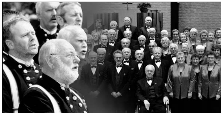
Passie en Paaszang op Stille Zaterdag

Steeds meer mensen hebben een mobiel toestel, maar weten er niet mee om te gaan. Bellen gaat nog net, maar hoe zet je er een nieuw nummer in, hoe kijk je welke oproep je hebt gemist, hoe luister je een voicemail af. Leer in 3 bijeenkomsten stapsgewijs wat de belangrijkste functies zijn op de mobiele telefoon. De cursus wordt gegeven in samenwerking met het projectbureau HulpRbij van Landstede. Samen met een student van de opleiding Helpende Zorg en Welzijn van Landstede oefent u op uw eigen mobiel. U dient dus wel een mobiel te hebben, als u aan de cursus mee wilt doen. Iedere cursist krijgt persoonlijke begeleiding en uitleg. De cursus is op de maandagen 12, 19 en 26 april van 10.00 uur tot 11.30 uur. De kosten zijn € 10,-. De cursus vindt plaats in SWO-punt de Horst, dichtbij dienstencentrum Werkeren. Heeft u belangstelling, geef u dan vóór 31 maart op via telefoonnummer 8515 700.