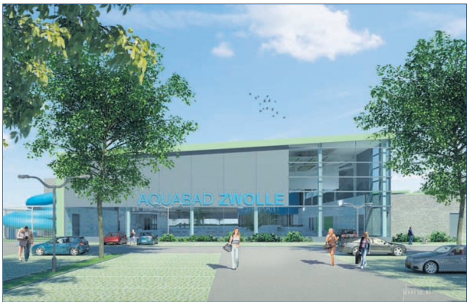
Het ontwerp van het nieuwe zwembad

Pellikaan Bouwgroep BV uit Tilburg mag de nieuwbouw van het toekomstige hoofdzwembad op bedrijventerrein De Vrolijkheid realiseren. Het college heeft vandaag ingestemd met het advies van de gunningcommissie. Met de ontwerpkeuze is de realisatie van een nieuw hoofdzwembad weer een stap dichterbij. Naar verwachting begint de bouw volgend voorjaar en kan het zwembad eind 2012 in gebruik genomen worden.