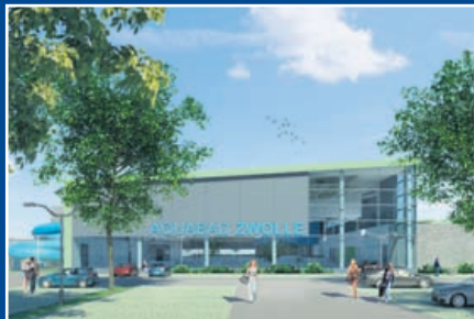
06 Nieuw zwembad Vrolijkheid