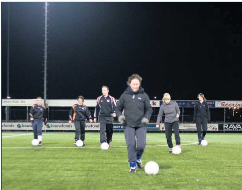
Op de training bij het damesteam van CSV '28