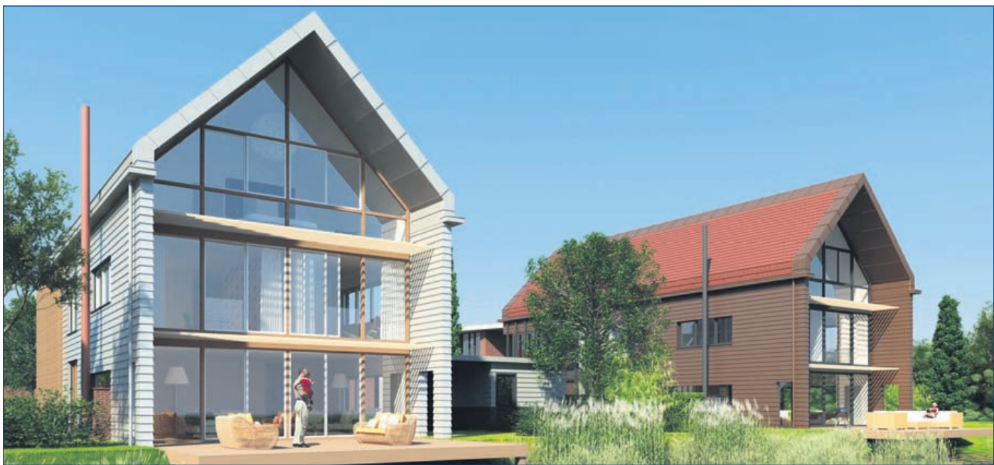
Een overzicht over het project en een impressie van de villa's