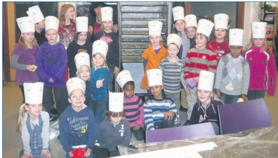
Poseren bij het bakkersblik

zelschap, met een groot bakkersrek met daarop de vers gebakken koekjes, weer naar het Cultuurhuis. Maar een grote windvlaag gooide roet in het eten en de koekjes lagen op straat. Om het kinderverdriet wat te verzachten bood de bakker gelijk aan om het 10 februari nog een keer over te gaan doen, nu zelfs compleet met bakkersmutsen en baronnen. Dit keer is alles naar wens verlopen en poseerden de kinderen trots bij het bakkersblik.