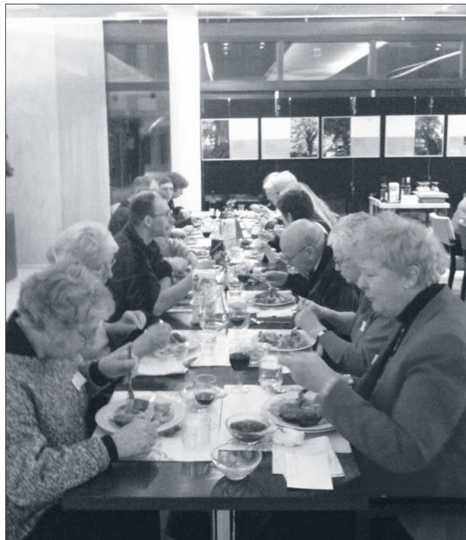
Gezellig samen eten