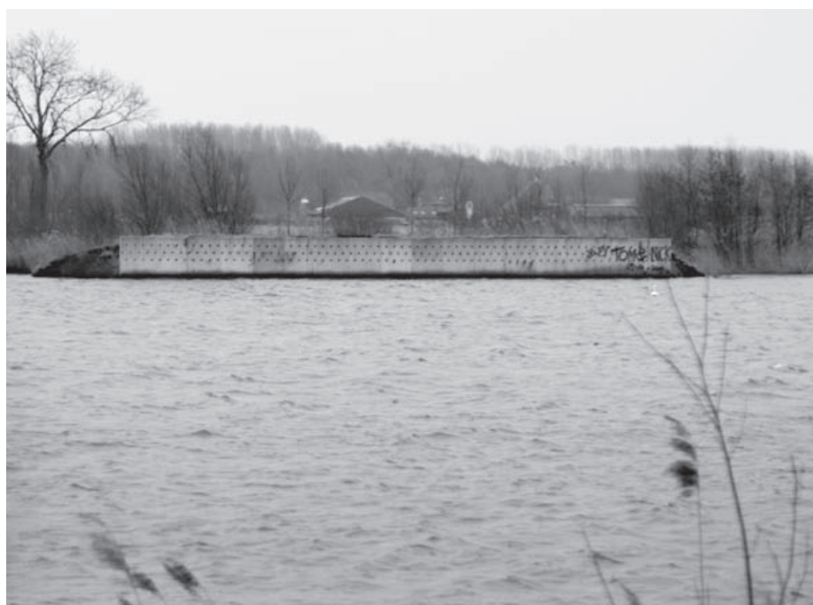
De kunstmatige nestwand in de Milligerplas