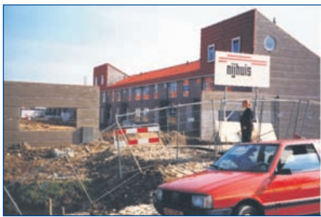
Wat moet dit worden?

Op de tentoonstelling "12½ jaar Stadshagen" in het Cultuurhuis is een 20 minuten durende presentatie te zien. Tijdens de presentatie wordt een compilatie getoond van oude foto's (van rond 1996) en nieuwe foto's (van rond 2008/2009). Op initiatief van Arjan Veldhuis (oud-bestuurslid van Wijkstichting Stadshagen Totaal) heeft een aantal bewoners van het eerste uur authentieke foto's ingezonden. Deze foto's, met daarnaast actuele opnamen, geven een indringend beeld van de situatie zoals die in de beginperiode van Stadshagen was en zoals die nu is.