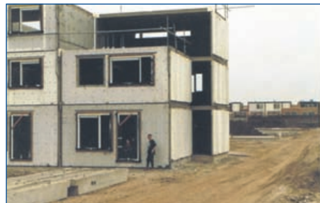
Komt wel goed