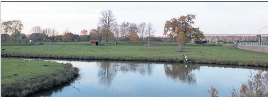
Huidig landschap bij de wijkboerderij