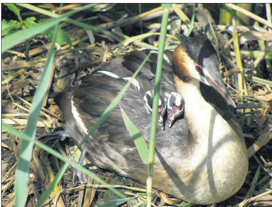
Fuut met twee jongen op rug in sloot bij hoge flat Beeldsnijderstraat

Stadshagen is waterrijk en dat betekent dat er veel vogels te zien zijn die daarvan afhankelijk zijn. Kokmeeuwen en meerkoeten worden hier veel gespot. Al drie winters wordt bij ons een meerkoet gezien die hier overwintert. Hij (of zij?) is geringd in Polen en vliegt ruim 600 km naar onze wijk om hier de winter door te komen. Met een witte halsring met daarop C18 is die goed te herkennen. Ik ben erg benieuwd of hij onze wijk weer weet te vinden. In de zomer zie je hier visdiefjes die in het water duiken om een visje te verorberen. Deze soort broedt in Zwolle-Zuid en haalt hier het voedsel. In het najaar vertrekt die naar warmere gebieden. Met een beetje mazzel zie je een overvliegende visarend of een groep kraanvogels. In Stadshagen zijn zo al 168 vogelsoorten gezien!