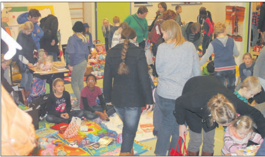
Leerlingen van 'De Sprankel' verkopen spullen voor Sri Lanka