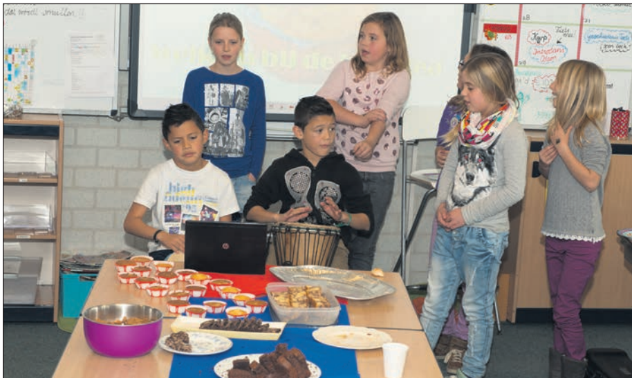
Leerlingen serveren high tea voor de Filipijnen

deze groep € 220,- in het laatje gebracht. In andere klassen waren er veilingen, talentenshows, kledingmarkt, auto's of fietsen wassen en oud-Hollandse spelletjes. Allemaal bedacht en uitgevoerd door de kinderen van de Zevensprong. De totale opbrengst voor het goede doel was deze dag ongeveer € 2500,-.