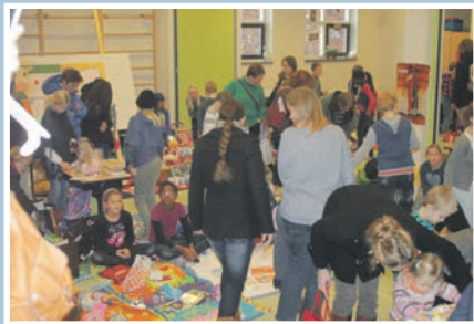
07 Koeien voor Sri Lanka