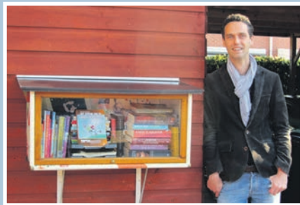
03 Kastje met leesvoer