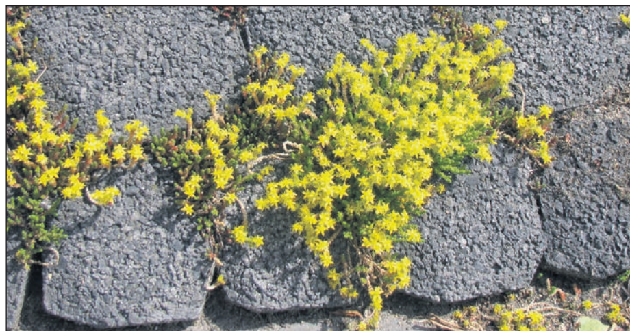
Bloeiende muurpeper in stenige wal bij Milligerplas

In dit inventarisatiejaar is ook gezocht naar de voorkomende vissoorten. Met een aantal van 10 verschillende soorten (o.a. vetje, kolblei, snoek, kleine modderkruiper) doet onze wijk goed mee in de biodiversiteit. Ook huizen hier maar liefst 30 verschillende keversoorten. Opvallend is dat daarbij zeven verschillende soorten van lieveheersbeestje zitten. Intrigerend! Ik ga mij maar eens verdiepen in deze groep.