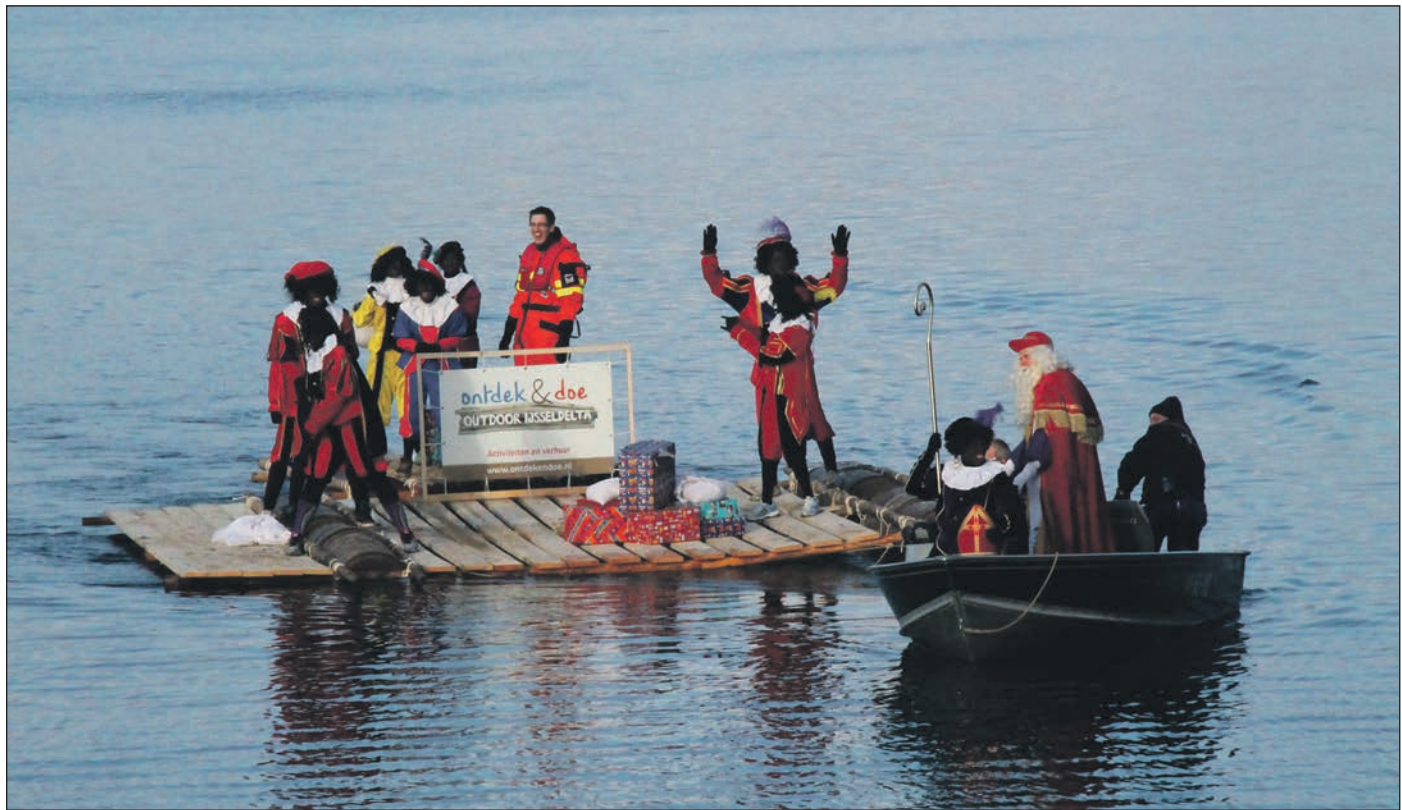
Het moet niet gekker worden!

Ondertussen had een grote groep kinderen zich al in het Cultuurhuis verzameld voor een ontmoeting met Sinterklaas en