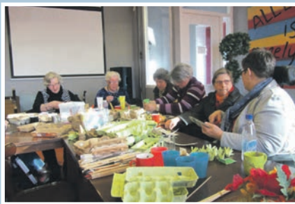
13 Inloopochtend Fontein