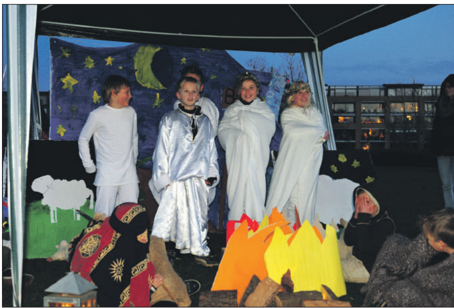
Engelen zingen 'Ere zij God' bij de herders in het veld.