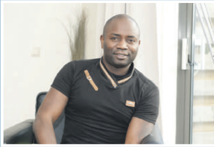
13 Cacaohandelaar in Stadshagen