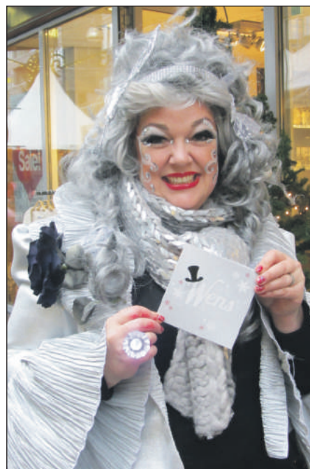
Een glitterdame met wenskaartjes

Terwijl vele ouders zich in de supermarkten en winkels begaven, konden de kinderen zich vermaken en knutselen in de Christmas Kids Club van Allio. DJ Etienne La Faille verzorgde de muziek, in een modern jasje. Je kon opwarmen in de tent met een beker warme chocolademelk, glühwein of snert en de inpakservice maakte van elk cadeau weer een verrassing! Als Mickey Mouse, Dora, Teigetje, Spongebob, sneeuwpop of in een winterlandschap; je mocht zelf kiezen hoe en met wie je op de foto wilde. Deze foto's zijn overigens te vinden op: www.winkelcentrumstadshagen.nl