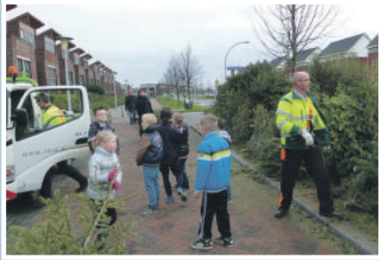
09 Kerstbomen slepen