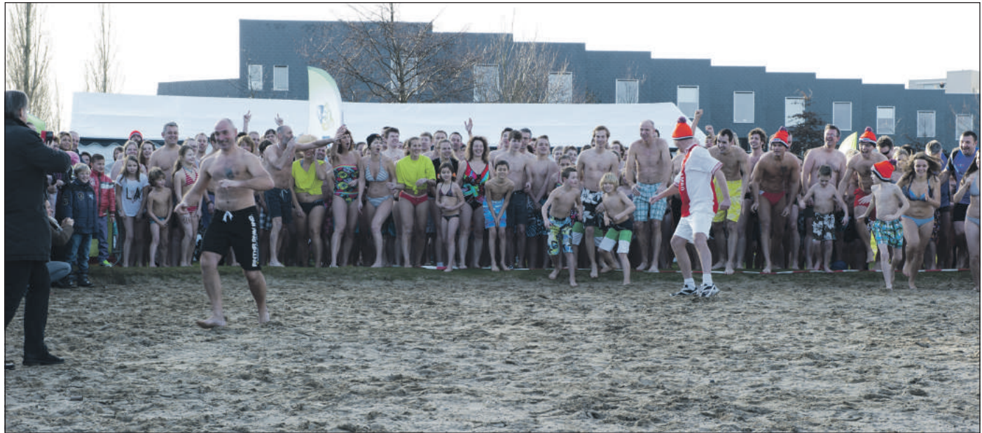
Klaar voor de start...

De meesten waren nog maar net gekomen van een knallende oudejaarsfuif, maar werden aangemoedigd door vele enthousiaste toeschouwers. Opzweepende muziek als 'Tsunami' schalde door de boxen. De sfeer zat er weer goed in en na afloop oogden de deelnemers uitgelaten en voldaan!