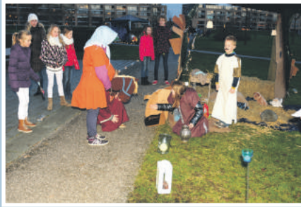
03 Lichtjestocht Twistvlietpark