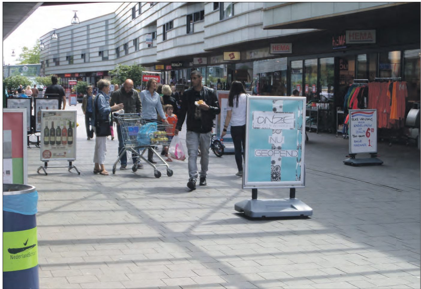
Het winkelcentrum bestaat tien jaar

In september en begin volgend jaar staan nog twee feestelijke acties gepland om het jubileumjaar te vieren. Kijk voor meer informatie over het winkelcentrum op www.winkelcentrumstadshagen.nl .