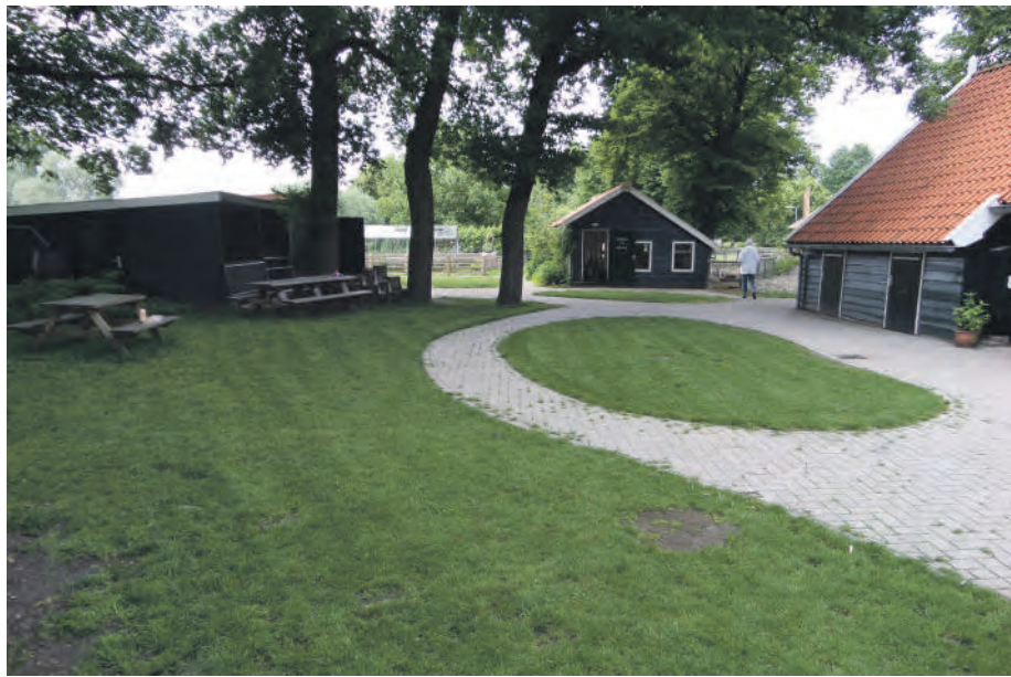
De Klooienberg is een wijkboerderij 2.0