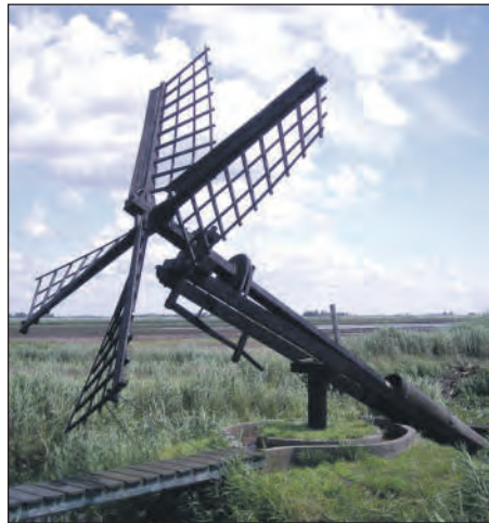
Een paaltjasker

De tjasker is een zogenoemde tonmolen. Een zeer eenvoudig type molen om water op te pompen. De ton ligt met de onderzijde in het water en een