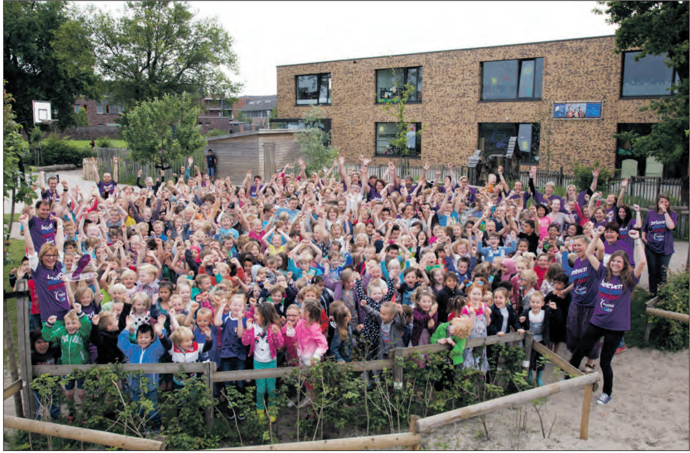
Leerlingen en team van de Schatkamer

De drie openbare scholen in Stadshagen organiseerden donderdag 15 mei, een week voorafgaande aan de landelijke actie, de sponsorloop SamenLoop voor Hoop. Doel: zoveel mogelijk geld ophalen voor KWF kankerbestrijding.