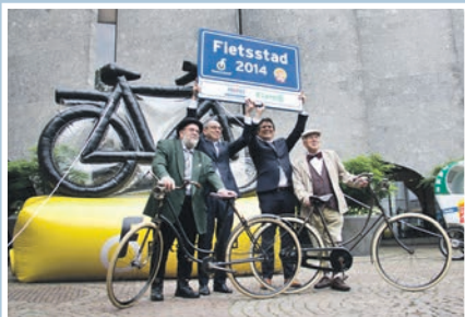
06 Zwolle Fietstad 2014