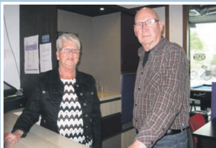
09 Vrijwilligers Cultuurhuis