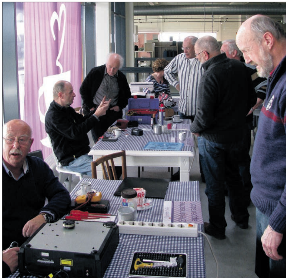
Op 7 maart 2014 is er ook een vestiging van Repair Café in Harderwijk gestart

In de rubriek Natuurbekijks is dit onderwerp op het eerste gezicht misschien een vreemde eend in de bijt. Niets is echter minder waar. Producten een tweede (of derde) leven geven betekent dat er geen extra grondstoffen en energie nodig zijn om nieuwe te produceren. Grondstoffen worden steeds schaarser en de fossiele brandstof raakt op. Vroeger gooiden productiebedrijven het afval gewoon weg, maar tegenwoordig moeten we zorgvuldig met de grondstoffen omgaan. Steeds meer materialen worden gemaakt volgens de zogenaamde circulaire economie, wat erop neer komt dat er na de productie en het gebruik er de fase is van recyclen, een vorm van kringloop van materiaal. Dit is zeker een trend maar nog geen gemeengoed.