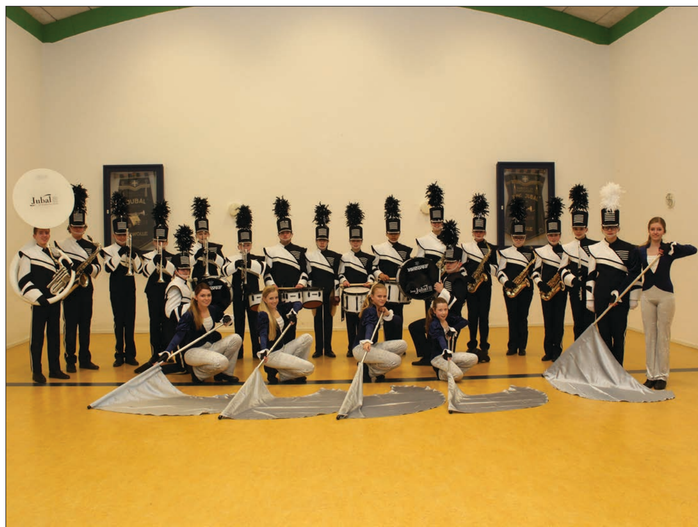
Jubal is klaar voor de show!