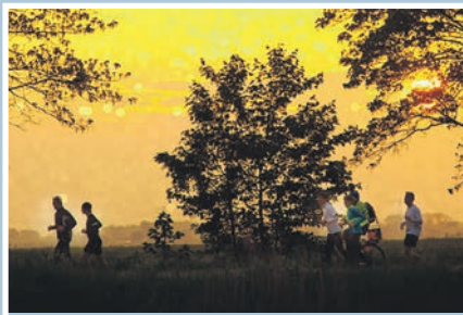
05 Nachtelijke marathon