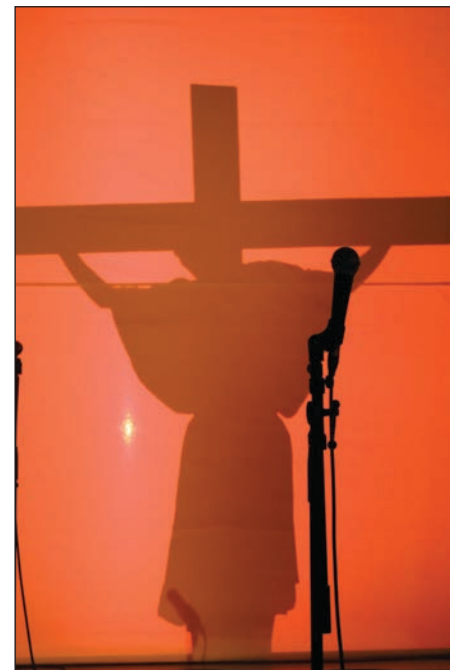
Schaduw van Jezus aan het kruis