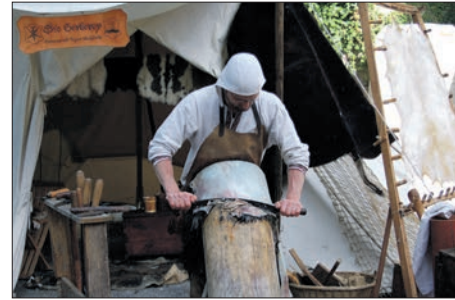
Een leerlooier aan het werk

Afhankelijk van de manier van leerlooien en het verkrijgen van het soort leer voor een bepaald gebruik zijn namelijk diverse bewerkingen nodig. De eerste bewerking bij het maken van leer is het villen van de huid van het dier. Bij het villen blijven resten vlees op de huid achter. Deze resten vlees moeten eerst worden weggehaald.