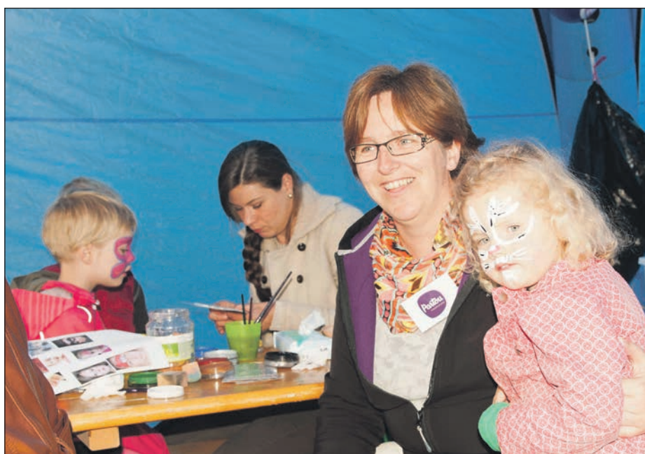
Kinderen werden geschminkt op moederdag