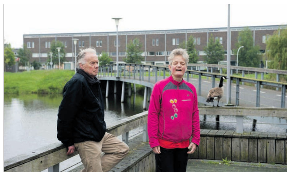
Wachtend op deelnemers voor de Sunsetloop

Voor de Sunset Loop wordt € 8 per keer gevraagd. Opgave kan via info@weerzicht.nl of 06 42414154. Meer informatie op www.weerzicht.nl .