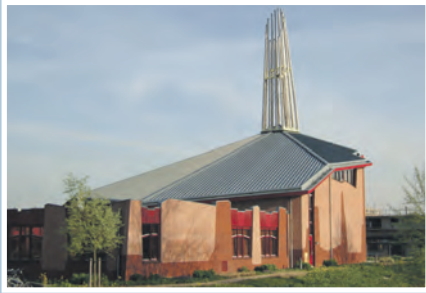
05 NSO in De Fontein