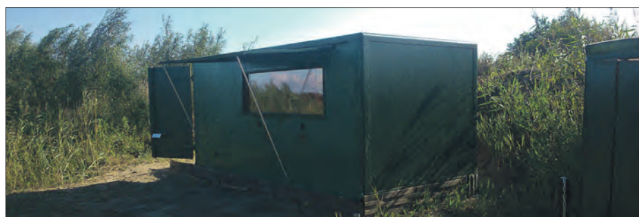
Onderkomen van de vrijwillige vogelringers in Stadshagen

Op verschillende plaatsen in de voormalige zandopslag worden mistnetten geplaatst. Voordat de zon opkomt, staan de netten klaar om de vogels die in het gebied zitten en gaan eten, te vangen. Vaak worden ze met een vogelgeluid gelokt. Alleen tijdens de vogeltrek wordt actief gevangen. Dit najaar is het ook mogelijk om een bezoek te brengen aan de ringbaan om te zien hoe het vogelringen precies in z'n werk gaat. In de Vinexpress van oktober leest u hier meer over.