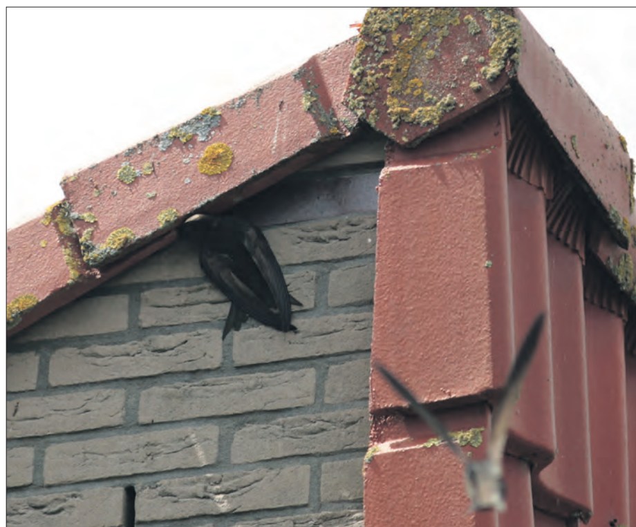
Gierzwaluw hangt aan muur net onder nestingang aan huis Zomertalinghof. Vaag zie je nog het silhouet van een andere exemplaar

In Stadshagen zijn veel huizen met platte daken. Daar zitten dan ook geen gierzwaluwen te broeden. Marco heeft in zijn eigen woonomgeving al eens gezocht