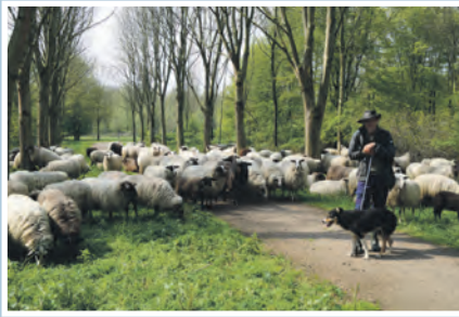
09 Schaapskudde naar Brecamp