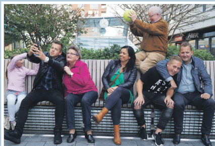
04 Actie tegen overlast