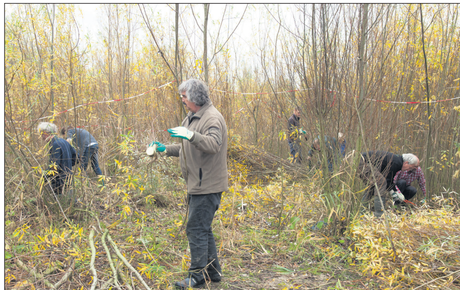
Bij vogelringstation Stadshagen is de begroeiing teruggesnoeid

De algehele organisatie van deze actieve dag is in handen van Landschap Overijssel. Die organisatie doet aan beheer en onderhoud van eigen natuurterreinen, maar zij stimuleert ook inwoners om actief on-