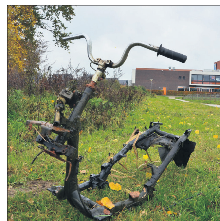
Resten van een brommer. Niet echt uit een product uit de tijd van Kasteel Werkeren

Oh ja, alvast voor in je agenda. Zaterdag 5 november 2016 is de volgende natuurwerkdag. Wil je daar niet op wachten, informeer dan (bijvoorbeeld via de website) bij Natuurmonumenten, Landschap Overijssel of Geldersch Landschap en Kasteelen of je al eerder lekker buiten mag werken. Leer het gebied en nieuwe mensen kennen. Ik wens je veel Vitamine G!