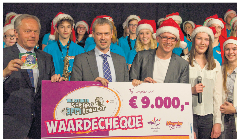
Meander Big Band cheque

Link naar videoclip: https://youtu.be/wwW9tQUCI2g