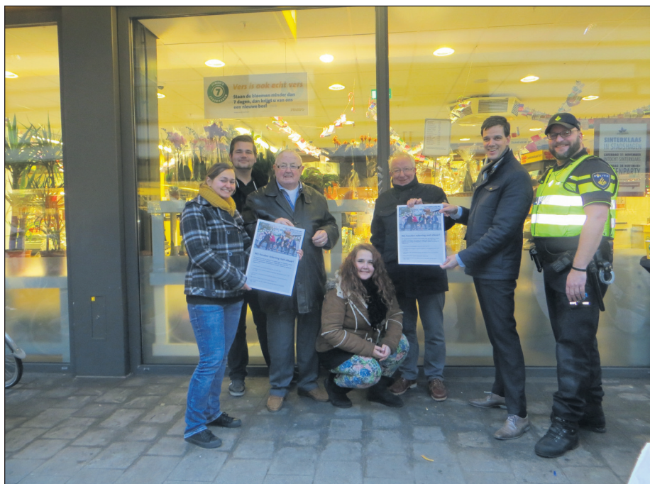
De start van de postercampagne in het winkelcentrum

Met de omvang van de wijk groeit de jeugd mee, in omvang en in leeftijd. De wijk kan inmiddels veel jongeren tot haar inwoners rekenen. En bij jongeren hoort