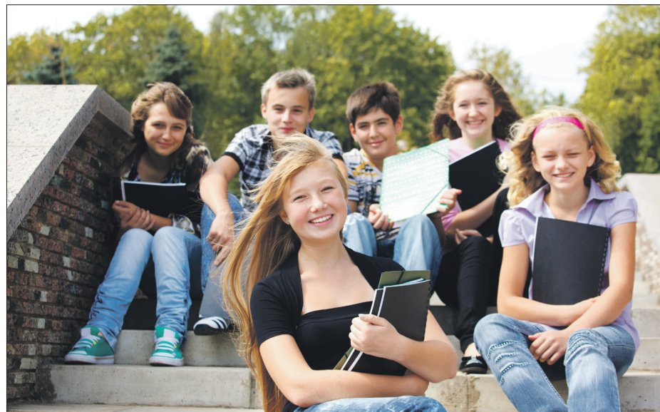
Meer leren in minder tijd en toch beter onthouden. Wie wil dat niet?

Voor meer informatie kunt u kijken op de website www.rtpraktijkvanegeraat.nl of neem contact op via telefoonnummer 06 20308014.