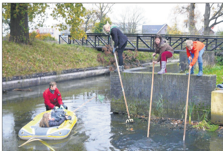
Met man en macht is het water van afval ontdaan