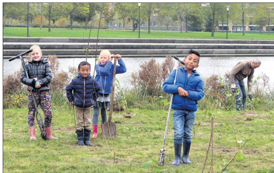
Noeste jonge werkers poseren graag voor een actiefoto bij basketbalveldje Twistvlietpark