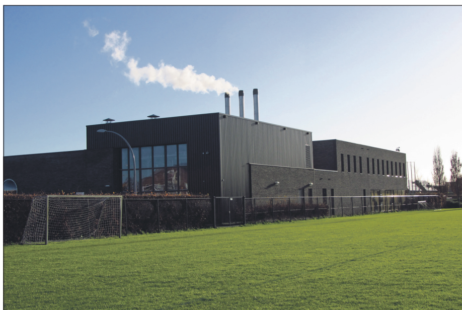
Breecamp Energie is verantwoordelijk voor de houtsnippercentrale, die zich naast zwembad Bubbels in de wijk Breecamp Oost bevindt.

De directe aanleiding van de avond was een bijeenkomst die eind september door Breecamp Energie werd georganiseerd en waar belangstellende partijen meer informatie konden krijgen over stadsverwarming. De bijeenkomst werd ook bijgewoond door leden van beide commissies. Zij hoorden een van de sprekers tot hun verbazing verklaren dat huishoudens die op de houtsnippercentrale zijn aangesloten, duurder uit zijn dan huishoudens die een conventionele gasaansluiting hebben – en dat is in strijd met de Warmtewet. Tot dan toe was steeds tegen de bewoners van Breecamp Oost gezegd dat ze niet meer zouden betalen dan bewoners