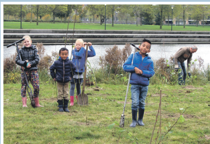
09 Handen uit de mouwen