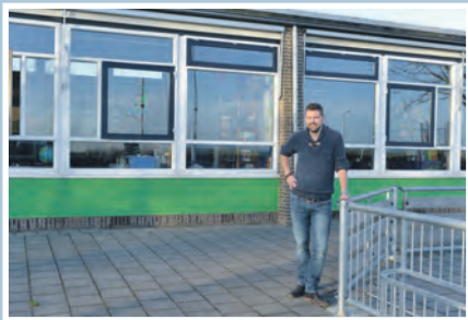
05 CBS De Driemaster