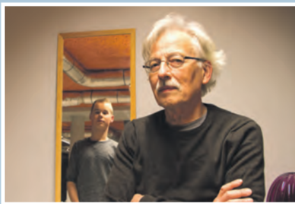
13 Theater Destijds