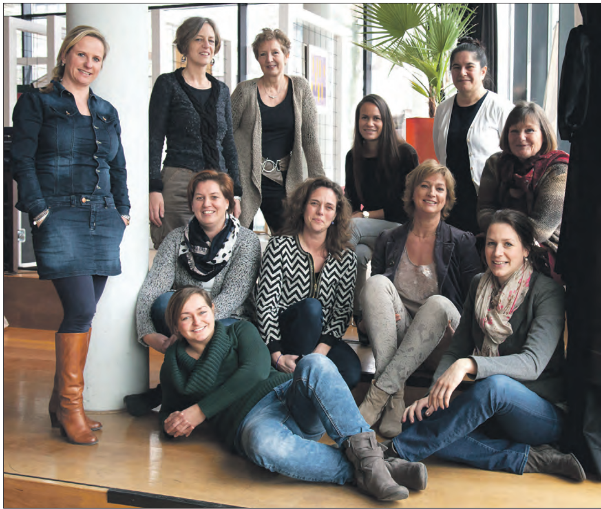
Het Sociaal wijkteam west stelt zich voor.