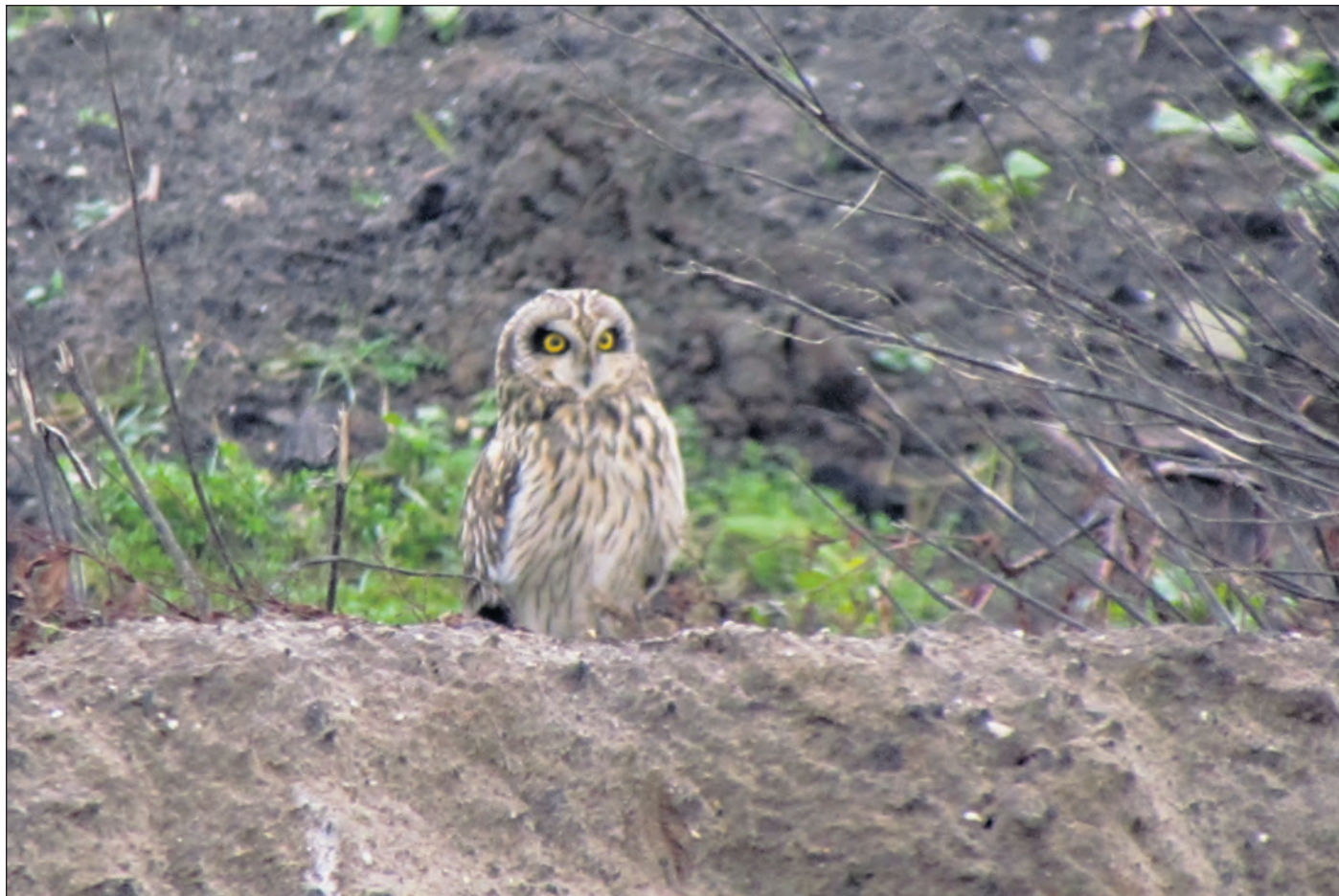
Een velduil op een berg grond langs de nieuwe rondweg en bij de tunnel onder de Oude Wetering

Op mijn 'bucketlist' prijkt al jaren een velduil. Tijdens vakanties op de Waddeneilanden speur ik altijd de horizon af om deze vogel eindelijk eens te mogen bewonderen; het is me nooit gelukt. De eilanden zijn bij uitstek het gebied waar ze voorkomen. Vooral op Texel en Ameland is de kans groot oog in oog te komen met deze uilensoort. Deze zomer kreeg ik meerdere berichten dat er veel velduilen werden waargenomen in Friesland en dat er zelfs vijf broedgevallen waren in de Mastenbroekerpolder. Ongekend. De wijk Stadshagen ligt ook in de Mastenbroekerpolder dus dat bood perspectief. Ik ben daarom een paar keer door de mooie polder gefietst, vaak alleen langs de randweg, Milligersteeg. Helaas. Tot midden januari weer eens door die steeg fietste en ik opeens twee velduilen zag vliegen. Ik kon mijn geluk niet op. Voor een buitenstaander klinkt dat wellicht vreemd, maar is zit daar niet mee.