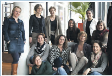
11 Sociale wijkteams