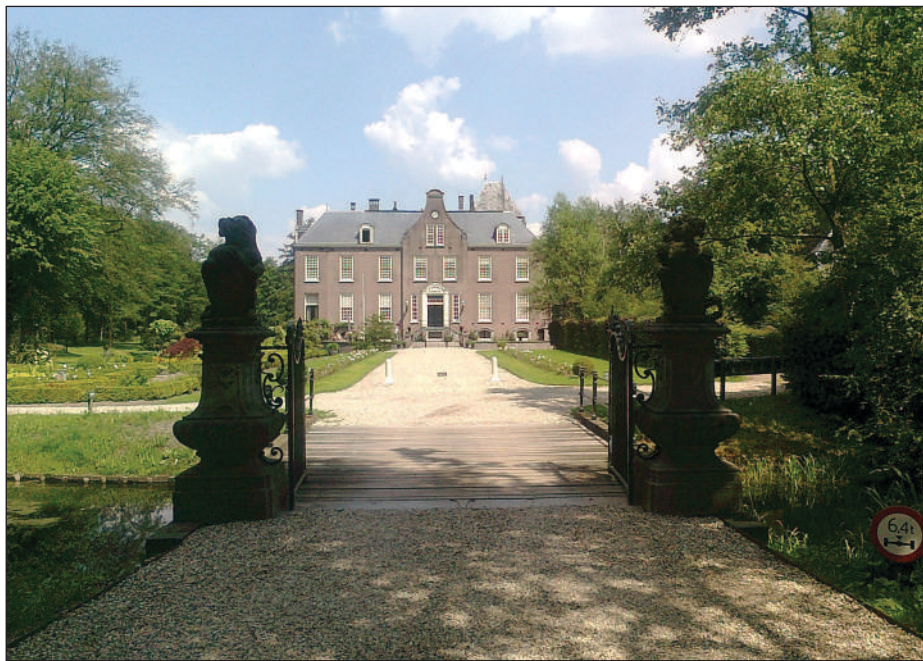
Kasteel Groot Hoerlo

de hemel' dat in 1992 werd gepubliceerd. Van dit 901 pagina's tellende boek gaat het verhaal dat Mulisch veel verwijst naar de omgeving en mensen uit deze regio. Groot Hoerlo zou model staan voor kasteel Groot Rechteren in zijn boek. Van het boek is in 2001 ook een film gemaakt. De opnamen waren echter niet op Groot Hoerlo maar vonden plaats op kasteel Het Nijenhuis. Dit ligt iets noordelijker. In 1994 werd Groot Hoerlo opnieuw verbouwd en opgedeeld in een aantal luxe appartementen.