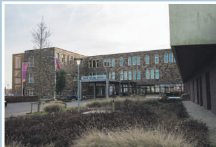
05 Vrijwilliger Zonnehuis