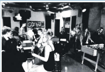
07 ABC-methode LevelZ