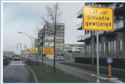
03 Kruispunt Belvédèrelaan