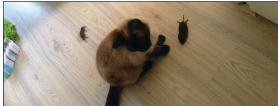
Dixie met twee muizen. Hier ook verschil in grootte goed te zien

Via www.waarneming.nl doen vrijwilligers melding van allerlei flora- en faunasoorten. Soms met foto, want dat geeft een ondersteunend bewijs van de soort. Landelijk zijn er deskundigen die de foto's bekijken en aangeven of de ingevoerde soort klopt. Met al die meldingen ontstaat een geweldige databank. Zo zijn er in Stadshagen al zes soorten muizen waargenomen. Dit zijn: huisspitsmuis, dwergspitsmuis, bosmuis, huismuis, veldmuis en rosse woelmuis.