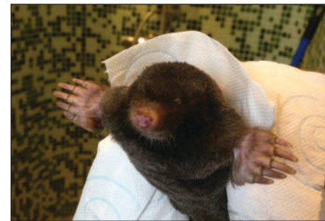
Deze dode mol had beter onder de grond kunnen blijven

Een inwoner van Stadshagen liet me foto's zien van de vangst van haar kat. Regelmatig komt die met een muis en zelfs een mol thuis. Vaak als speelkame-raadje lekker dollen in de woonkamer! Het gezin vindt het best leuk dat de kat met die vangst binnenkomt. Ook de kinderen leren zo dat er muizen in hun omgeving zitten en dat er verschillende soorten zijn. Soms is het wel even zoeken waar de muis nu weer gebleven is, maar de kat weet daar wel raad mee.