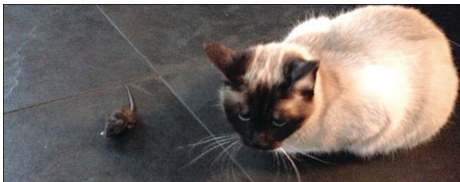
Alweer een opgebrachte levende muis in huis

je simpel meedoen met het verspreidingsonderzoek. Maak een foto van de zijkant van kop tot staart. Deze foto ga je vervolgens uploaden via www.waarneming.nl . Onder het tabblad 'Invoeren' zie je het onderdeel 'Wat vangt de kat'. De rest wijst zich vanzelf. Deskundigen beoordelen de foto en geven de muis een soortnaam. Wil je meer weten over muissoorten dan is het handig om een Zoekkaart Muizen aan te schaffen. Via Google kom je hier wel verder mee.