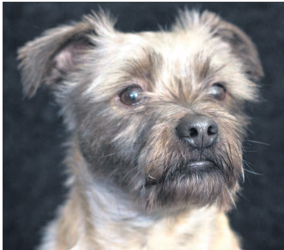
En hoe vinden jullie mijn nieuwe foto?

dat ik dode dieren eet, maar wat ik pas echt eng vond is dat ik ook heel erg goed verzorgd wordt door mijn mensen. Stel je nou eens voor dat ze dat alleen maar doen, omdat ze me uiteindelijk op willen eten. Pinokkio moest gelukkig heel hard lachen, toen ik hem vertelde waar ik bang voor was. "Wij honden horen bij de mensen bij wie we wonen, net als hun kinderen en die eten ze toch ook niet op. Daar hoeft je echt niet ongerust over te maken. En als je geen vlees meer wilt eten, dan moet je vegetariër worden." Toen moest Pinokkio mij natuurlijk eerst weer uitleggen wat een vegetariër is. Maar dat lijkt me niks. En plakje komkommer, een stukje tomaat of een stukje appel op z'n tijd vind ik best lekker. Maar nooit meer vlees... ik moet maar niet teveel aan die dode dieren denken als ik een keertje een plakje worst krijg en ik zal mijn mensen zeggen dat ze op de Partij voor de Dieren moeten stemmen. Waarom is er eigenlijk geen Partij VAN de Dieren? Misschien ga ik ook wel in de politiek. Dan richt ik de BBB, Beweging voor Bewuste Blaffers op. Daarover een volgende keer misschien meer. Tot blafs.