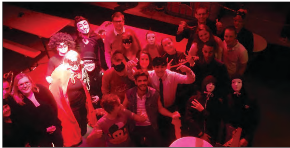
Het Vrijwilligersfeestje in LevelZ was een groot succes