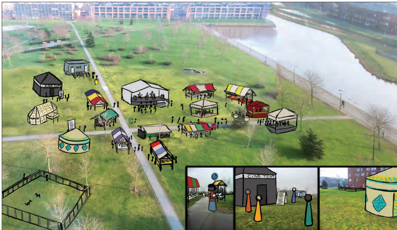
Sfeerimpressie van het festivalterrein

Het wordt een festival met een hoog sociaal maatschappelijk en informatief karakter. Waar culturele activiteiten een podium krijgen en waar de verbinding met de natuur wordt gelegd door inspiratiesessies met sprekers te organiseren en informatiestands in te zetten. "Hier krijgen onder andere Urban-gardening en de wijkboerderij zichtbaarheid. Tevens wil het festival begrip voor elkaars culturen in de wijk creëren. En via het thema Natuur de aandacht vestigen op het belang van duurzaamheid. De uitvoering van deze thema's en aandachtsgebieden geschiedt door middel van dans, theater, muziek, film, animaties, workshops, spelen, eten en mode." Onder andere Travers Welzijn en LevelZ worden betrokken bij de organisatie.