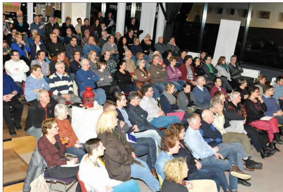
Grote belangstelling voor de wijkdialoog in het Cultuurhuis

“Het eerste dat opvalt is dat mensen vanuit hun eigen situatie gaan praten. Dat toont wel aan hoe moeilijk het is om uit de vergadercultuur te komen en in de praktijksituaties gaat zitten. Hoe dit opgelost moet worden? Daar is nog niet echt een antwoord op. Dat wordt een enorme klus”, aldus een wijkbewoner over de input voor de sociale wijkteams. Een andere wijkbewoner over de input voor het beheer van de openbare ruimte: “Wat opviel was dat de wijk qua groen volgens ons wel wat spannender mocht. Met meer ruimte om te spelen en meer educatie. Het Akkerbergplein is een voorbeeld van zo’n bewonersinitiatief met een speellocatie en tuinen. Mensen worden hierbij betrokken. Bij beheer van groen is de essentie ‘samen doen’. Daarbij is het volgens ons belangrijk om te zorgen voor continuïteit. Dat kan door bijvoorbeeld kinderen van de basisscholen simpele dingen te laten doen en later de pubers er ook nog steeds bij te betrekken door hen meer verantwoordelijke taken te geven.”