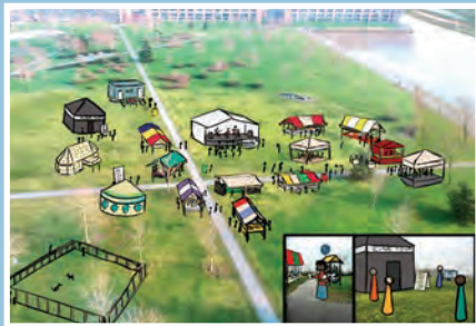
05 Cultuur Festival Stadshagen