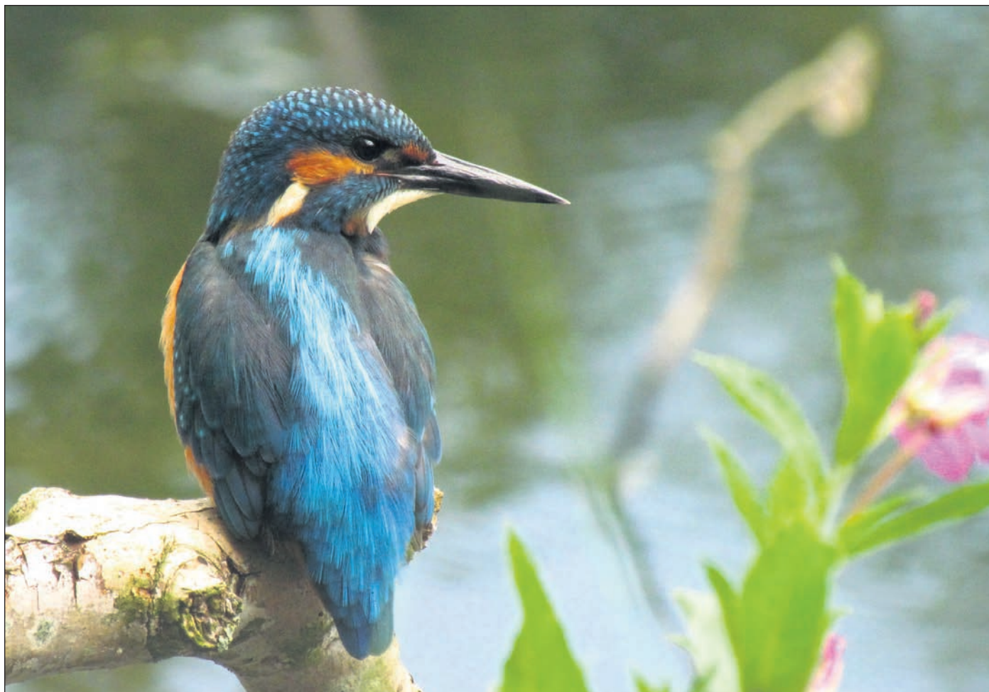
IJsvogel gekiekt op een uitkijktokje boven het water

Voor het eerst sinds deze telling staat de kokmeeuw niet bij de eerste drie. Nu is het wel zo dat deze soort altijd lastig tellen is. Wanneer wijkbewoners brood voeren, schieten deze meeuwen daarop af. Het kan zijn dat je daar net geteld hebt en dus de 'vogel gevlogen is' op je nieuwe telplek. Ook de Grote Canadese Gans laat het afweten. Met ijs trekt die uit de wijk, maar daarvan is nu geen sprake. Deze ganssoort verraadt zijn aanwezigheid