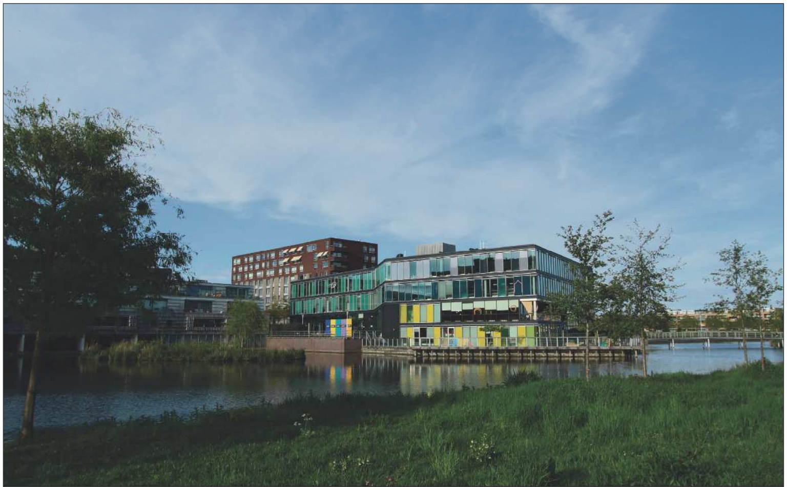
De bibliotheek in het Cultuurhuis zal nog tot zeker 2018 open blijven.

Door het openhouden van de vestigingen moesten de bezuinigingen op een andere manier worden opgevangen. Van der Wal: "We moesten ruim 170.000 euro aan bezuinigingen doorvoeren en dat was voor ons bijzonder pijnlijk. We hebben een aantal functies moeten schrappen en we kwamen er ook niet onderuit om 10% op ons collectiebudget te bezuinigen. Uitgangspunt hierbij was dat onze dienstverlening op peil moet blijven."