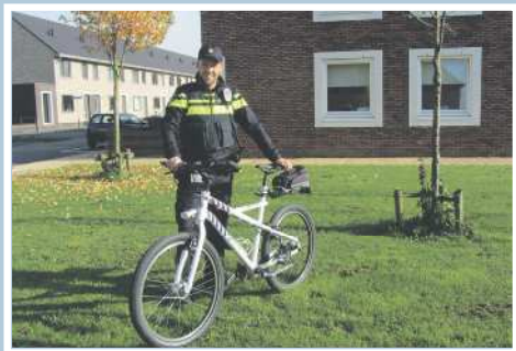
03 Nieuwe wijkagent