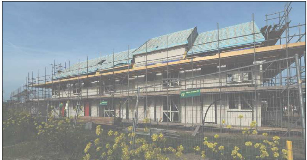
De wijk in aanbouw

straks alles klaar is, en opgeleverd lijkt het zeker de moeite waard hier een wandelingetje te maken, in combinatie met een wandeling door het oude buurtschap en het daarachter liggende park.