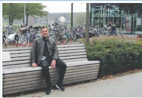
14 Nieuwe jongerenwerker