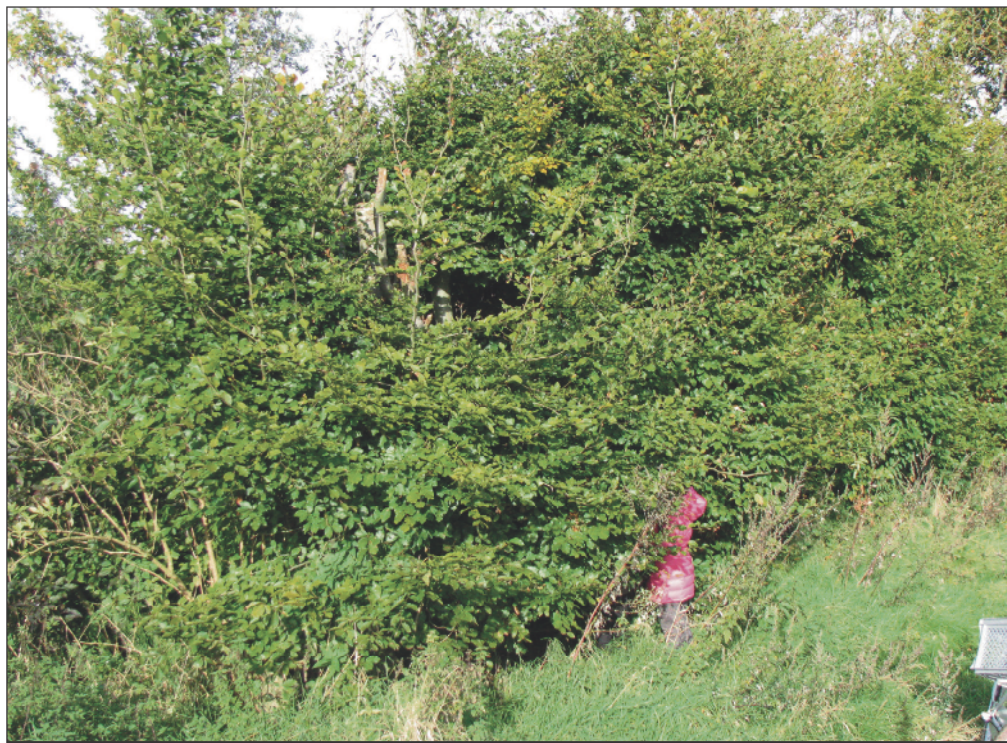
Meisjes zijn druk om een hut te maken in oude beukenhaag bij locatie wijkboerderij De Stadshoeve

Al heel wat jaren hebben wij een bijzondere invulling van kerst. Geen cadeaus meer onder kerstboom. Wij hebben een andere vorm bedacht. Ieder familielid mag twee goede doelen nomineren voor een geldbedrag. Elke aanwezige levert €25 in de pot. Totaal is er dus jaarlijks € 225 te verdelen. Na alle nominaties wordt er gestemd. Ieder lid mag drie stemmen geven. De organisatie met de meeste stemmen, krijgt het totale bedrag. De afgelopen jaren wonnen: Natuurmonumenten, Alzheimerstichting, Rode Kruis, Stichting Vluchteling, Waddenvereniging en de Nierstichting. Dit jaar ga ik De Stadshoeve nomineren. Ik doe mijn best. Lijkt me geweldig om met kleinkind daar te struinen.