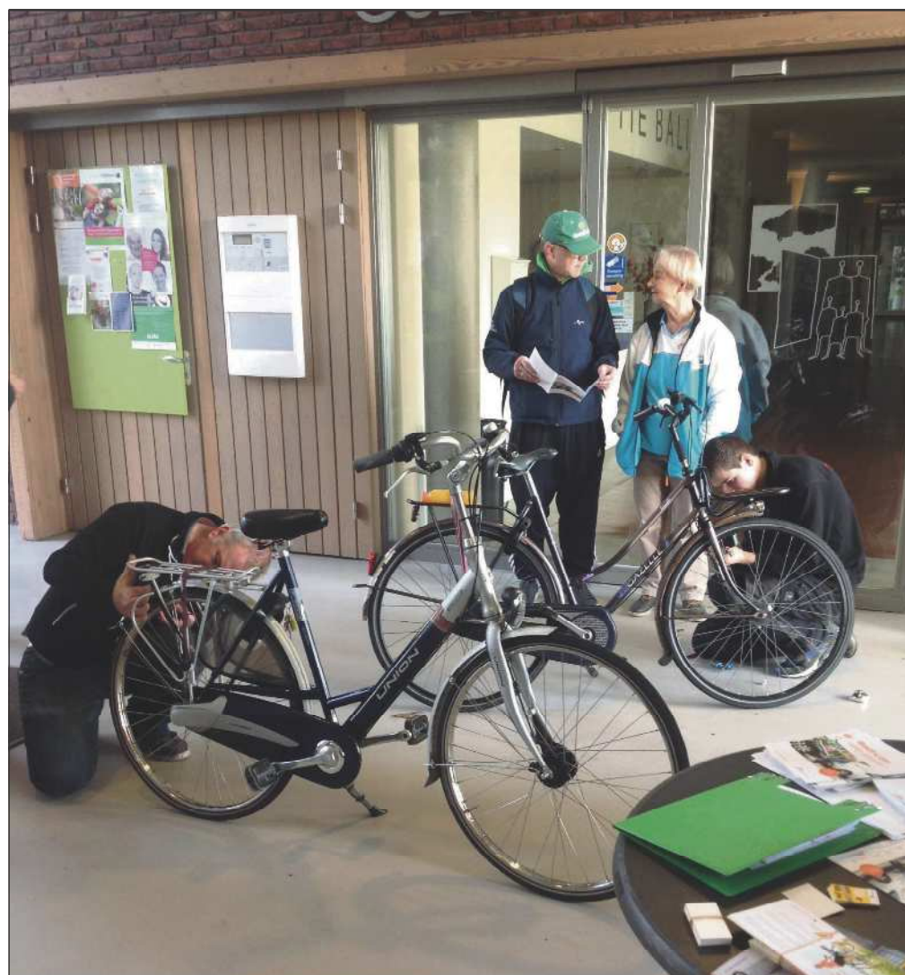
Fietsreparateurs druk aan het werk