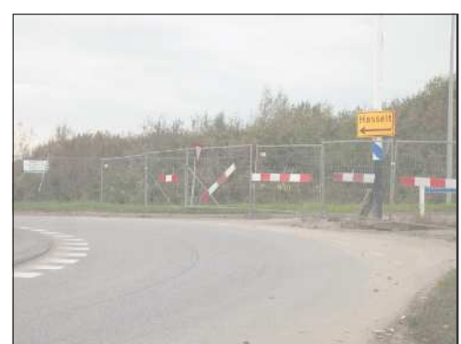
Rotonde Milligerlaan en Stadshagenallee