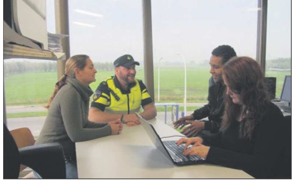
Jongeren, jongerenwerker en wijkagent in gesprek met elkaar

"Omdat we hier een wijk zijn met het hoogste aantal jongeren in de stad, zetten wij naast het aanspreken van jongeren ook in op het creëren van begrip bij bewoners. De jeugd en jongeren zijn een belangrijk onderdeel van de wijk. Zij verdienen een plek. Vanuit de samenwerking tussen bewoners, wijkagenten en jongerenwerkers proberen we contact te leggen met de verschillende partijen om de onderlinge communicatie te verbeteren en om te onderzoeken wat de behoefte van de jeugd is. Op dit moment gebeurt dit bijvoorbeeld in een werkgroep bestaande uit jongeren, bewoners, winkeliers, jongerenwerk, gemeente en politie."