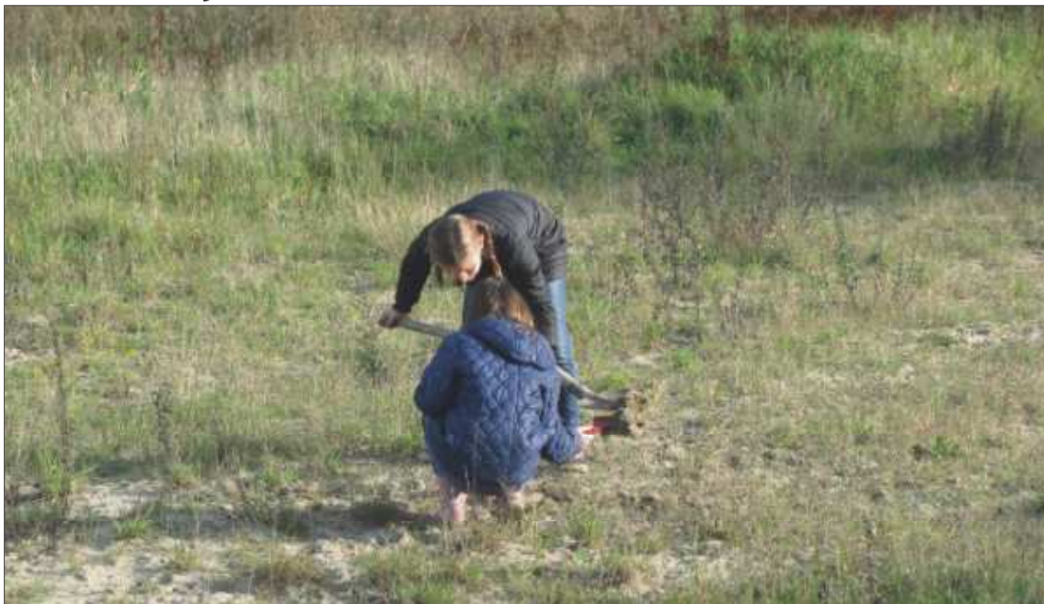
Twee meisjes peuren naar wormen om te vissen op toekomstige locatie wijkboerderij De Stadshoeve

Op zaterdag 7 november was er weer de natuurwerkdag. In Stadshagen zijn maar liefst vier projecten waar je je handen uit de mouwen kon steken. Tientallen inwo-