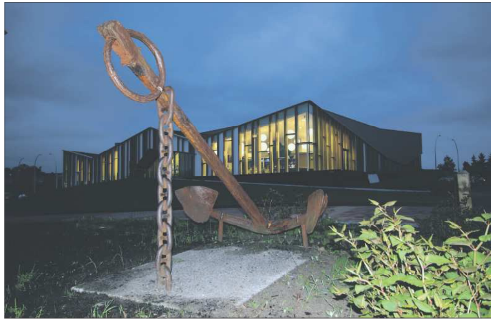
Het Nieuwe Anker is een ontmoetingscentrum voor zowel Westenholte als Stadshagen.