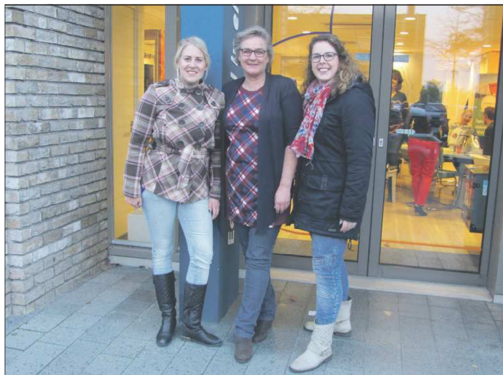
De spelcoaches kijken uit naar buurtgenoten

Op zaterdag 12 december is er voor buurtgenoten een gezellige bingoavond! Aan ondernemers uit Stadshagen is gevraagd om prijsjes ter beschikking te stellen. De avond begint om 19.00 uur. De spelleiders hopen op veel enthousiaste deelnemers uit de wijk. We houden er rekening mee dat deze avond wat uit kan lopen. Vragen of opmerkingen? Bel 06 1012 0700.