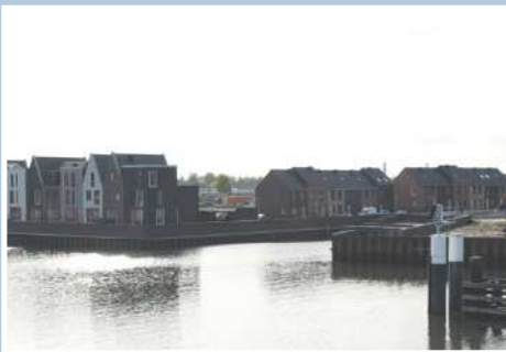
17 Nieuwbouw Hasselterdijk