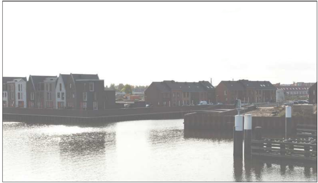
De wijk is (bijna) af

Een haventje geeft toeristen met plezierjachten de mogelijkheid om tijdens de vaart van Hasselt naar de IJssel (en vice versa) een stop te maken bij het buurtschap Frankhuis en eventueel een bezoek te brengen aan Stadshagen. Het Twistvlietpark ligt op loopafstand van het haventje van Frankhuis. Een van de historische pareltjes van Stadshagen, de Rademakerszijl, zou wellicht bij het haventje onder de aandacht gebracht kunnen