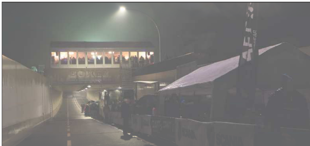
Feesttent op de tunnel tijdens de opening