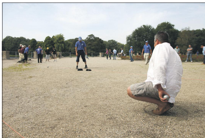
Jeu-de-boules zoals het in Frankrijk gespeeld wordt.

Twee mannen vertellen graag hun verhaal. Ze zijn half augustus via het aanmeldcentrum in Ter Apel in Zwolle gearriveerd. Ze blijven maximaal vier maanden in de IJsselhallen. In deze periode wordt hun asielaanvraag behandeld. De bestemming daarna is nog onbekend. Het gemis van familieleden doet pijn. Als dit ter sprake komt trekken ze de schouders hoog op, alsof er een koude windvlaag langskomt. Even staren ze in het niets, de gedach-