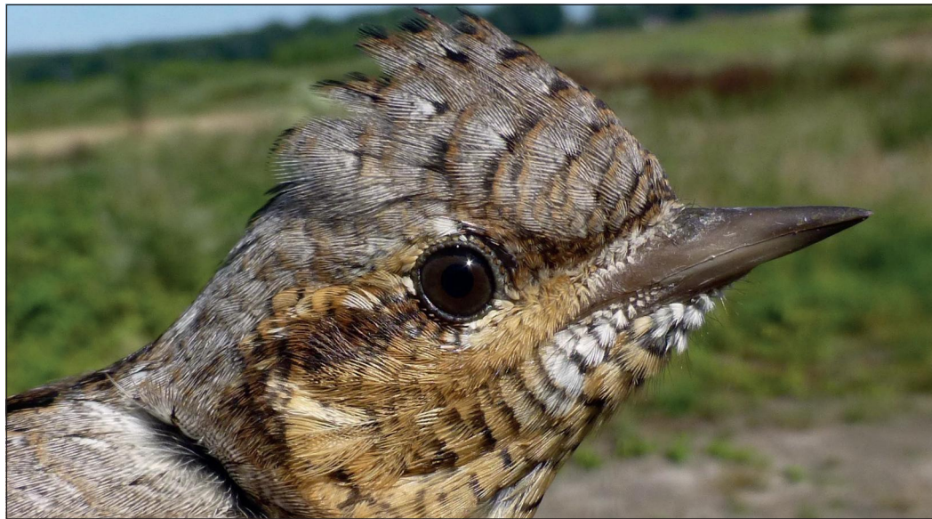
"Draaihals broedt sporadisch in Nederland. Dit exemplaar komt waarschijnlijk uit Scandinavië. Hier vlak voor de vrijlating"

Tussen juli en medio september zijn er ruim 28 honderd vogels gevangen. Er zijn vangdagen met slechts twintig vogels, maar tijdens de vogeltrek loopt dit soms boven de honderd exemplaren op. Het is altijd weer een verrassing wat en hoeveel er in de netten zit. Maar bijna drieduizend vogels is toch wel een serieus en opvallend aantal. Van die drieduizend zijn er ruim tweeduizend geringd. En de rest dan? De andere vogels hadden al een ring. De meeste daarvan zijn op dit terrein al eerder gevangen en geringd, dan is er sprake van een terugmelding. Wanneer zo'n terugmelding in het broedseizoen plaatsvindt, kun je stellen dat die vogel hier broedt. Buiten het broedseizoen kan het zijn dat die hier foerageert om later verder te trekken. De meeste vogels trekken naar een warme omgeving in het broedseizoen en daarna weer terug.