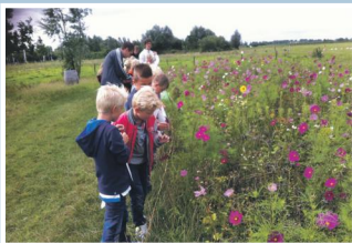
03 Bloemenpracht Stadsakkerz