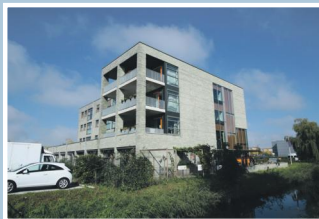
04 Woonlocatie Ingelandhof