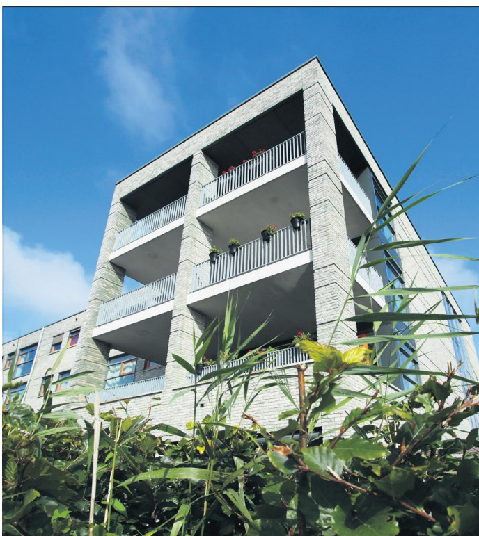
Iedereen zeer tevreden over de Ingelandhof