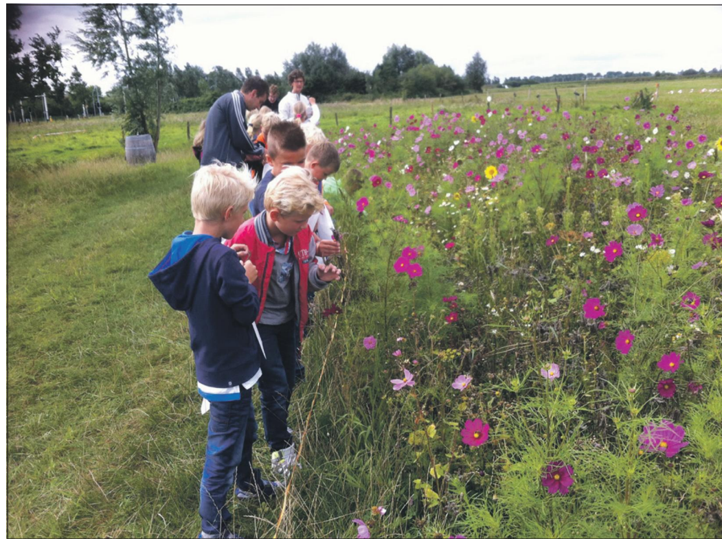
Bewonderende Wendakkerkinderen bij het bloemenlint