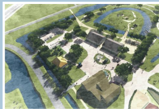
15 Crowdfunding Stadshoeve